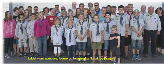
Bildet viser speidere, ledere og foreldre fra Narvik og Kragerø

TEKST/BILDE: STEINAR BRØGELAND REDIGERING/BILDE:ERLING SKARV JOHANSEN